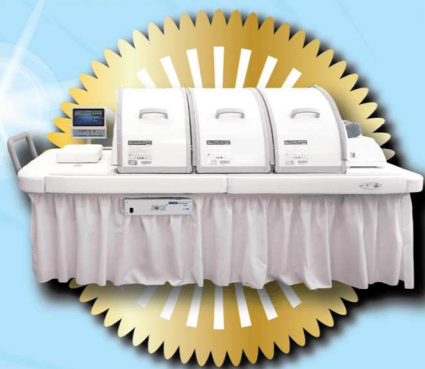
氧身工程床組 - 升級版 價值: $37,600