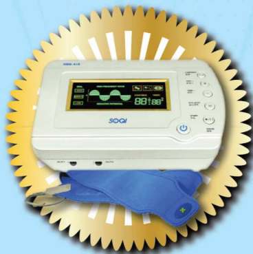
E-POWER 價值: $6,980