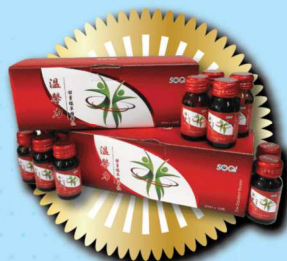
溫馨力6盒 價值: $3,300