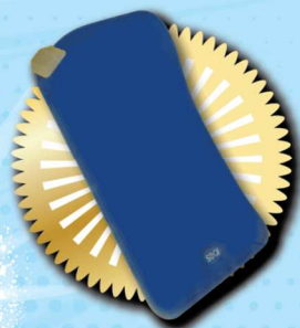
導波坐墊 價值: $1,680