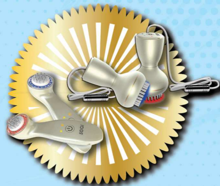
臉部紅藍光導波儀 價值: $1,580 身體紅藍光導波儀 價值: $1,980