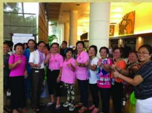
會長跟香港興美利家人們大合照。

第四天的行程，我們去了毒蛇研究中心跟免稅購物中心。香港的家人再次顯現強勁的購買力，將購物中心掃平！每個人手上都提著戰利品，興高彩烈的回酒店休息！最後一天，我們參拜了四面佛就去機場乘搭飛機回香港了。這一次旅行，有不少家人是第一次跟團出發，她們都說：