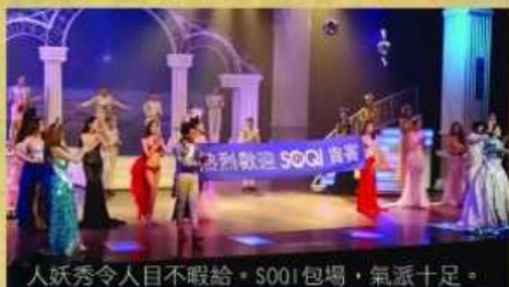
人妖秀令人目不暇給。SQI包場，氣派十足。

下午，我們就去到美輪美奐的SIMON STAR人妖秀。曾經有人說過，人妖是泰國的國寶，今日一見，此言非虛！一堆很漂亮的舞者穿著金光閃閃的衣裳在舞台上起舞，看得觀眾都目不暇給，最後的結尾更拉著一幅歡迎SQI貴賓的橫額。原來這場表演是SQI包場了，真威風！