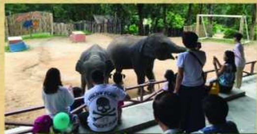
泰國大象樂園，當然小不了精彩的大象表演。

的商店外，景色建築更是一絕。一個地方，不同時間，不同感覺。傍晚，我們到了裡面的皇家雅園自助餐大快朵頤。填飽肚子就去劇場欣賞表演。經過一天充實的行程，終於到達我們下榻的希爾頓酒店。酒店的裝潢、設備高級得不在話下。更甚的是，酒店更為SOQI設立一個專櫃，行李直接送上房間，只需在車上領取房間就可以直上酒店，好舒適！