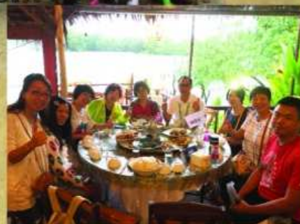
泰國美食令人忍不住舉起手指公。