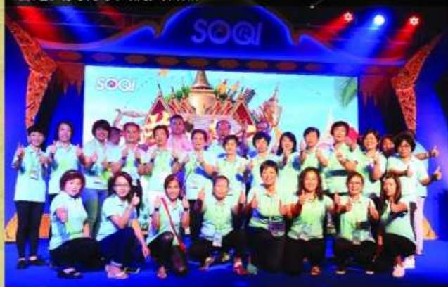
香港興美利家人們大合照。

的家人也眼泛淚光。之後就到了表演環節，香港分公司打頭陣，上台大合唱《海闊天空》，把整晚的氣氛帶到高潮，台下的家人都分別手牽手跟著節奏搖擺，揮動手上的旗幟，每個人都融入了大會。然後慶生大會要開始了，由會長潘常雄先生把禮物送贈於九月份生日的幸運兒，一起許願，一起切蛋糕，就像跟家人慶祝生日那樣親切，那樣高興！