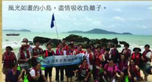
風光如畫的小島，盡情吸收負離子。