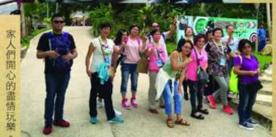
家人們開心的盡情玩樂。